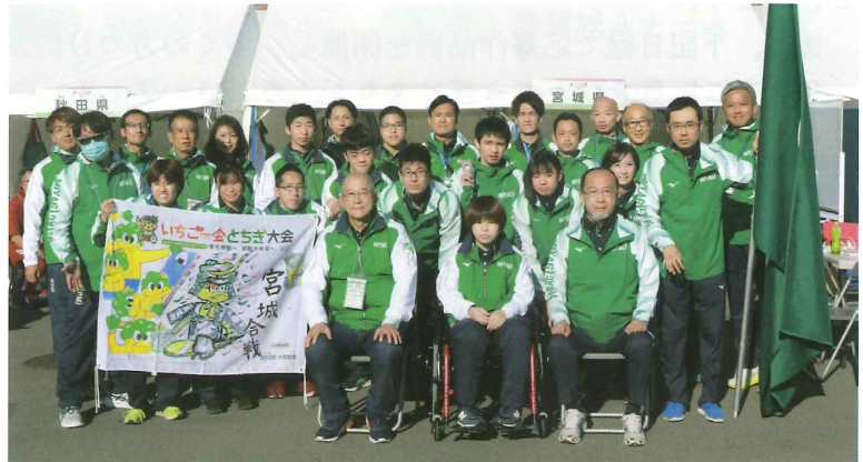
陸上競技の選手と役員