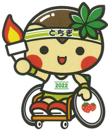
マスコットキャラクター「とちまるくん」