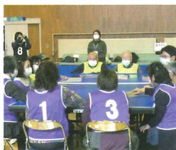
丸森 - 多賀城B