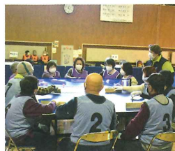
岩沼 - 多賀城B