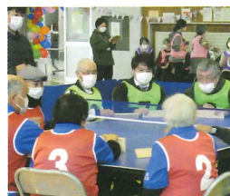
山元町 - 気仙沼B